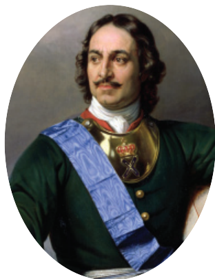
Император Петр I

Сообщениями «о похищении казны» первоначально занималась тайная канцелярия во главе с графом П.А. Толстым. И работала она на совесть. Но были и такие дворяне и чиновники, которые к проблеме мздоимства относились гораздо терпимее. По рассказам современников, однажды в Сенате Петр пригрозил издать указ, по которому всякий, кто украдет у казны сумму, на которую можно купить веревку, будет повешен. Генерал-прокурор Ягужинский на это заметил: «Неужели вы хотите остаться императором без служителей и подданных? Мы все воруют — с тем только различием, что один больше и приметнее, чем другой».